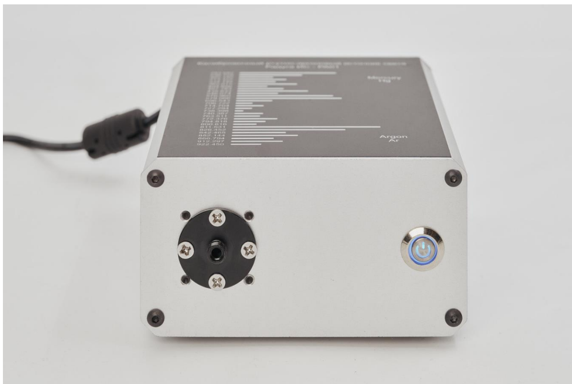
Рисунок 1 - Общий вид источника РАДУГА ИС-РА-01

1.3 Общий вид источника РАДУГА ИС-РА-01 приведен на рисунке 1.